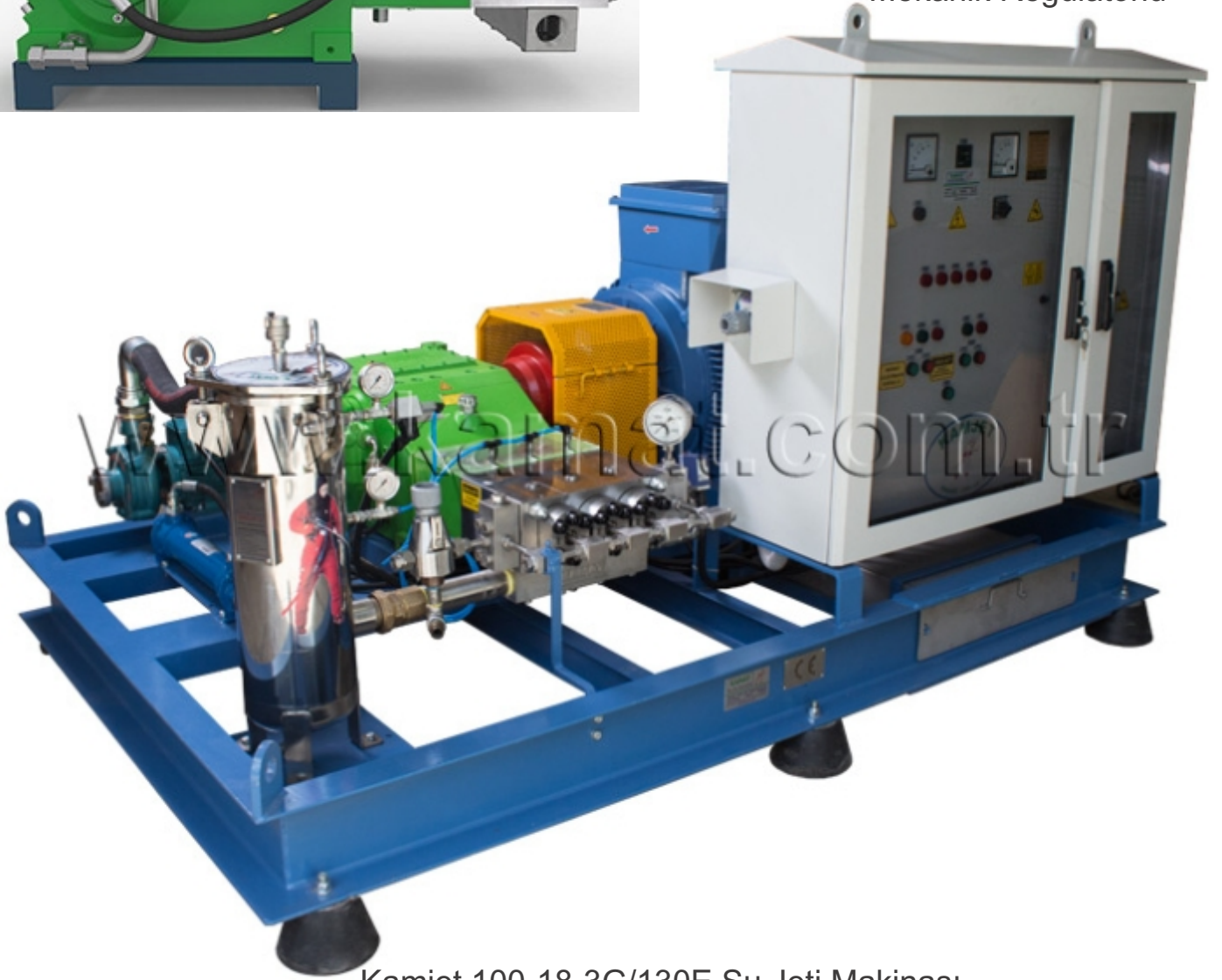
Kamjet 100-18-3G/130E Su Jeti Makinası

P= 2050 Bar Q= 34 lt/dak Motor= 130 kW-1450d/d Mekanik Regülatörlü